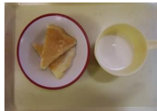
<マーマレードケーキ>