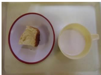
<シンプルホットケーキ>