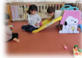
お部屋のおもちゃであそんでいます