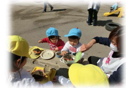
園庭で元気にあそぼう！！