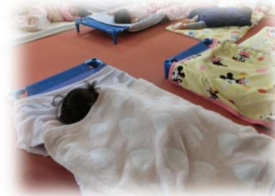
いっぱい遊んだ後はお昼寝で休息♡