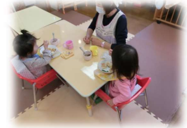
給食タイム♪お友だちとたべるとおいしいね！