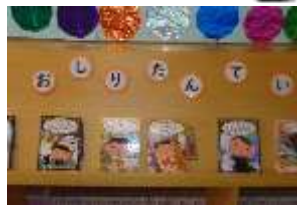
おしいたてい おもしろいよ!