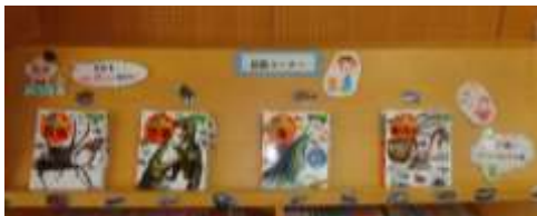
図鑑が新しくはいりました😊